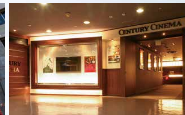
センチュリーシネマ